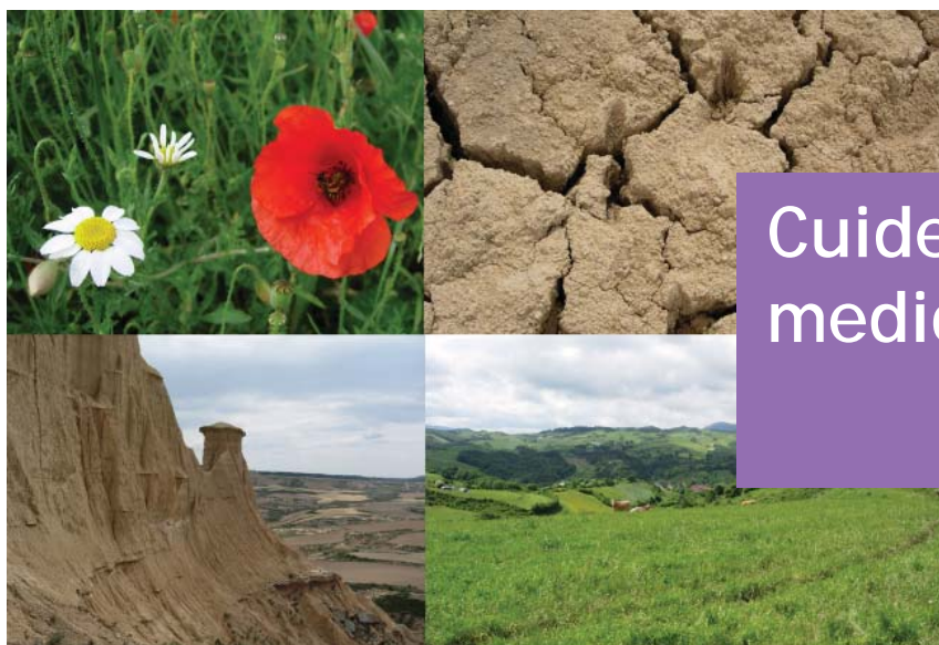
Bardenas Reales y Roncesvalles (Navarra)

AUTORA: Noelia Alcarazo Profesora de Español en la Universidad de Manchester